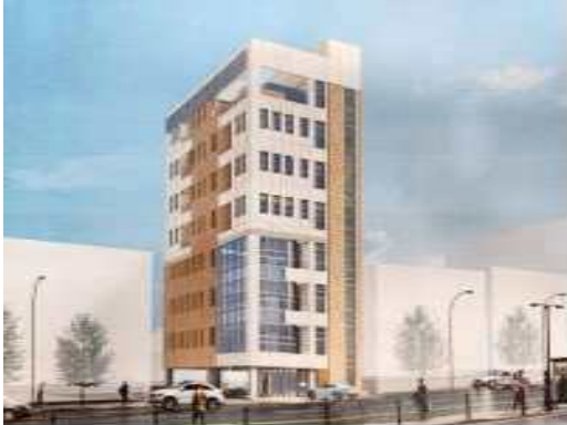
[ 조감도 ]