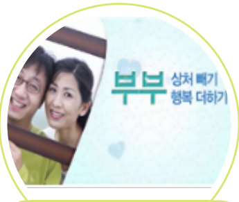
부부 상처배기, 행복 더하기

일 시 : 2020. 5. 9.(토) 장 소 : 현안심리상담소 대 상 : 미성년 자녀를 양육하는 재판이혼 과정의 부모 내 용 : 이혼의 의미, 이혼 후 공동양육을 위한 부모역할 훈련