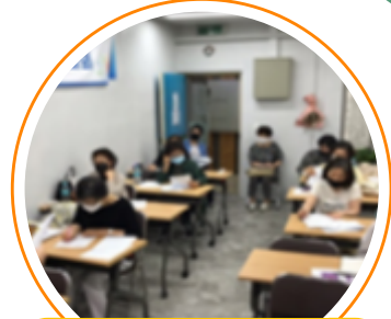
생활 속 거리두기 실천 '5월 상담사례회의'

일 시 : 2020. 5. 1.(금) ~ 5. 22.(금) 장 소 : 신청자 각 가정 대 상 : 서로를 이해하기 원하는 부부 내 용 : 부부 존중감 높이기, 멈춰버린 사랑을 움직이게 하라 등