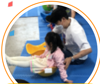
아버지-자녀가 함께하는 토요일 FLY-DADDY

일 시 : 2020. 5. 9.(토) 장 소 : 우리 새마을금고 본점 대 상 : 4~7세 자녀와 아버지 내 용 : 아버지와 자녀가 함께하는 체육활동