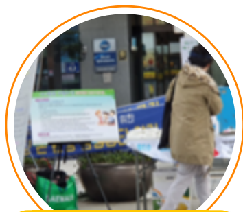
코로나19 지역확산 예방 및 가정의달 기념 전시 캠페인

일시 : 2020. 5. 15.(금) 14:00~16:00 장소 : 구남로 일대 대상 : 구남로 이용객 누구나 내용 : 코로나19 지역확산 방지 및 정보 전달 배너전시, 가정의달 기념 배너전시, 예코 방바구니, 물티슈 배부, 건강 가정지원센터 리플렛 비치 등