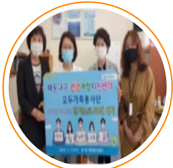
모두가족봉사단 코로나19 극복위한 면마스크 기부