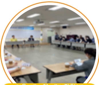
해운대구지역사회보장협의체 대표협의체 회의

일시 : 2020. 5. 12(화) 장소 : 해운대구문화복합센터 대상 : 유관기관의 장 내용 : 20년 협의체 활성화 방안 및 운영규정 개정안 등 논의