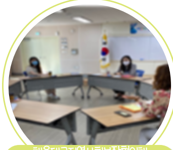
해운대구지역사회보장협의체 실무분과 회의

일시 : 2020. 5. 12(화) 장소 : 해운대구문화복합센터 대상 : 유관기관의 장 내용 : 20년 협의체 활성화 방안 및 운영규정 개정안 등 논의