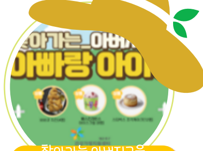
찾아가는 아버지교육 아빠랑 아이랑

일시 : 2020. 4. 20(월)~5.15(금) 장소 : 신청자 가정 내 대상 : 청소년기 자녀를 둔 부모 내용 : 성관련 용어 및 발달단계에 따른 성교육